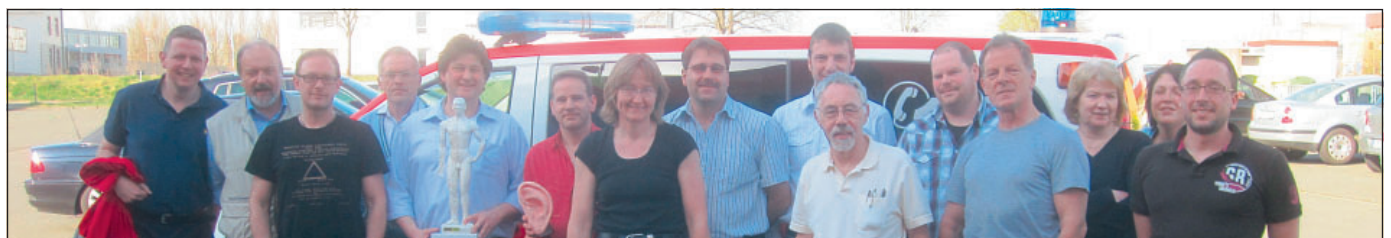
Abb. 3: TeilnehmerInnen des ersten Wetzlarer Seminars „Akupunktur in der Notfallmedizin“